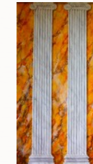
Colonnes et faux marbres