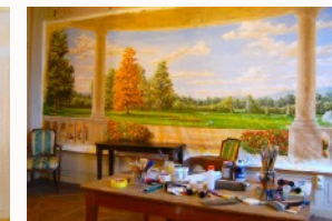
De la maquette à la réalisation